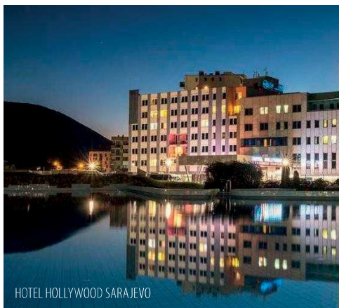
HOTEL HOLLYWOOD SARAJEVO