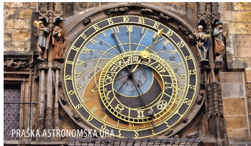
PRAŠKA ASTRONOMSKA URA