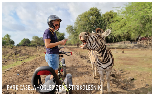
PARK CASELA - OGLED Z EKO ŠTIRIKOLESNIK