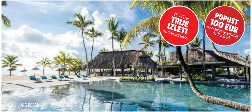
HOTEL LONG BEACH

Zajtrk. Ob 12. uri odjava iz hotela. Prosto do prevoza do letališča. Polet iz letališča Mavricij do letališča Istanbul predvidoma ob 20:05 uri. Pristanek v Istanbulu ob 5:10 uri. Nadaljevanje poleta proti Ljubljani ob 6:45 uri. Pristanek v Ljubljani ob 7:55 uri..