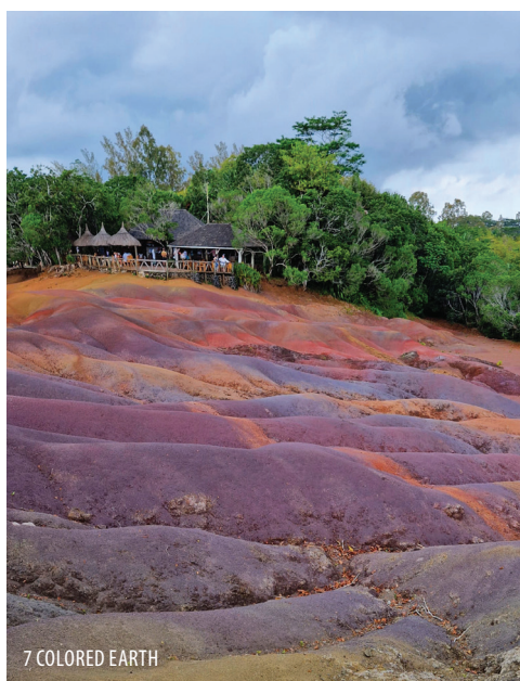
7 COLORED EARTH

Relax garancija za kakovost www.relax.si